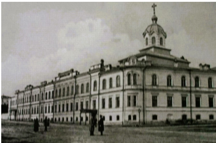
Ставрополь. Женская гимназия св. Александры