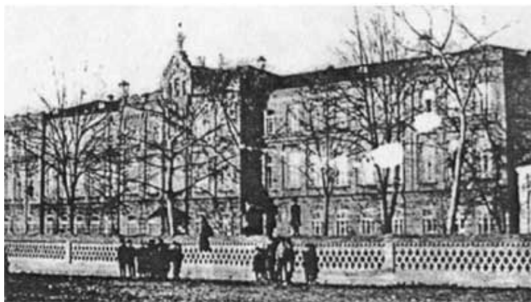
Ардон. Александровская миссионерская духовная семинария

Рассчитанная не на три (как в училище), а на шесть классов (причем на каждый класс отводилось по одному году), программа семинарии несколько приближала ее к светским средним учебным заведениям. Основную учебную программу составляли богослужебные дисциплины, общеобразовательный цикл включал исторические и математические дисциплины, педагогику, дидактику с основами психологии и логики, пение и т. п. В отдельный блок входили языковые предметы – русский и осетинский (преподаваемым сверх учебной программы) языки, при этом осетинский проходил всеми учениками безотносительно к национальной принадлежности, поскольку он рассматривался как предмет «миссионерский». Занятия осетинским языком с учениками русскими, грузинами и «вообще не-осетинами» начинались с 3-4 классов и заключались в чтении осетинского Евангелия, которое, как считалось, при надлежащем старании могло помочь в освоении осетинской разговорной речи. Для семинаристов-осетин преподавание языка начиналось с 1-го класса: сначала с чтения букваря и выучивания некоторых молитв, а с 3-го класса – богослужебных книг и стихов осетинских поэтов. Чтение дополнялось «поучениями на разные случаи и между прочим по поводу