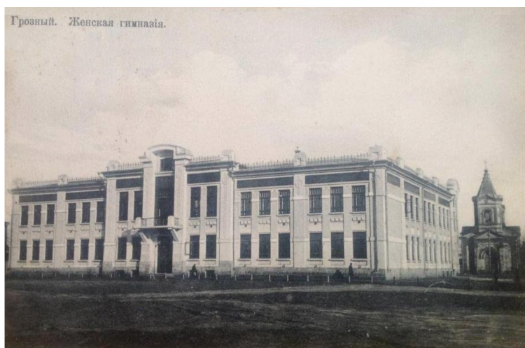
Грозный. Женская гимназія.