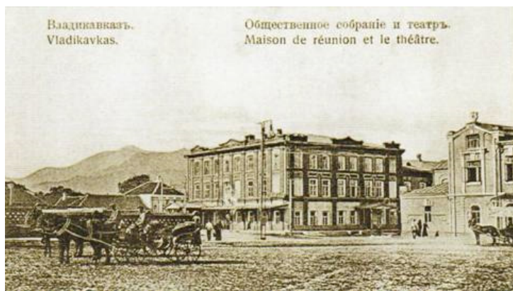
Владикавказ. Общественное собрание

В 1876 г. в Моздоке с разрешения Кавказского цензурного комитета и начальника Терской области открылась библиотека литературы на восточных языках, в том числе учебники и произведения духовного и светского содержания 125 . А в феврале 1878 г. свою библиотеку открыло моздокское дворянское собрание 126 .