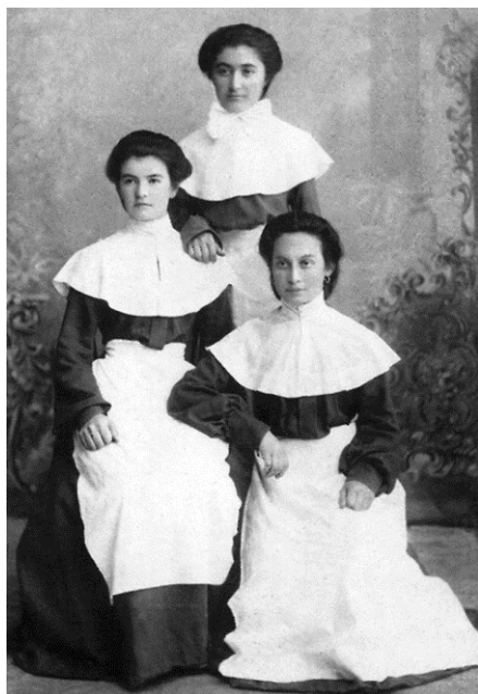
Воспитанницы Владикавказского Осетинского женского приюта

Основной контингент учениц в приюте составляли осетинки, но среди них были и девочки других национальностей – в том же 1898-99 учебном году среди 80 воспитанниц четыре были грузинками, восемь – русскими. Примерно такое же соотношение учениц по этническому составу отмечалось и в другие годы 377 .