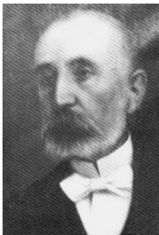
Джантемир Текаевич Шанаев