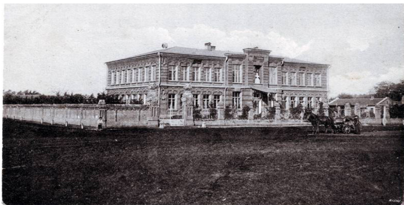
Пушкинская народная аудитория

В трех бесплатных владикавказских аудиториях Общества – женской прогимназии, Пушкинской аудитории и на Курской слободке при Вознесенской церковно-приходской школе – в течение этого периода было устроено «114 чтений: по естествознанию, географии, русской истории, литературе и по брошюрам духовно-нравственного содержания». Одни чтения предназначались для взрослых, другие для детей. Чтения посетили 13700 человек, из них преобладающее большинство составляли дети 441 .