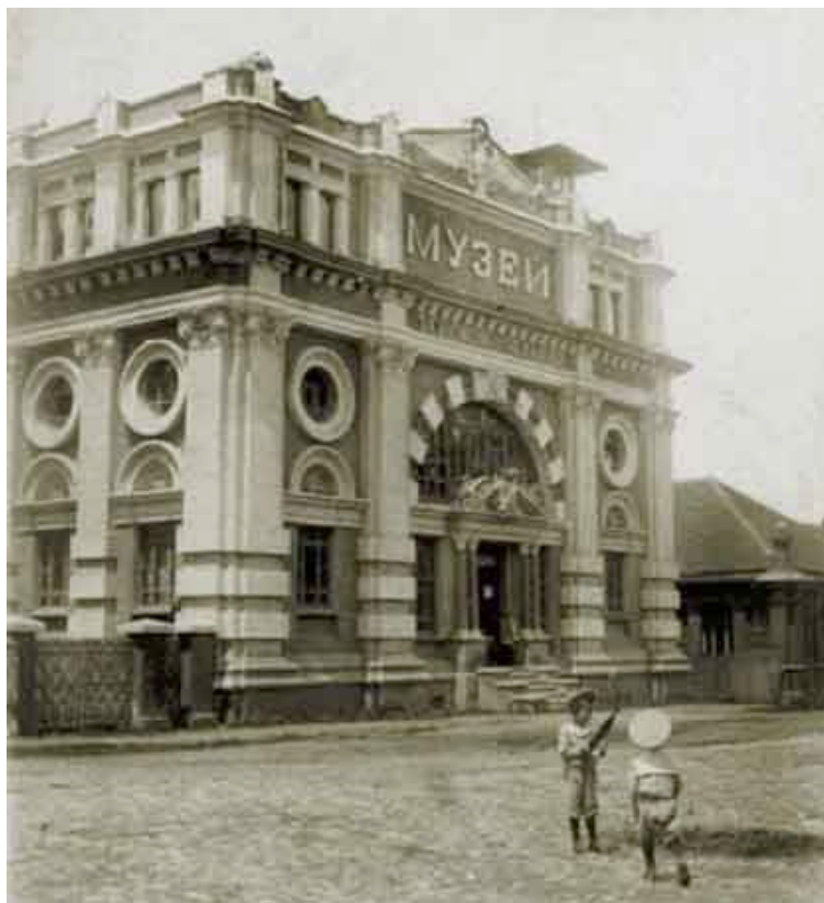
Владикавказ. Терский областной музей

Устав определял цели и задачи музея прежде всего как просветительские и охранные: «Терский областной музей имеет целью содействовать распространению в населении познаний по истории, этнографии, естествознанию и промышленности, а равно собирать и хранить памятники старины и искусства края». В уставе прописывались структура музея, в которой было представлено семь отделов и библиотека, права и обязанности его хранителя и других должностных лиц, определялась принадлежность музея Терскому казачьему войску, на средства которого музей должен был существо-