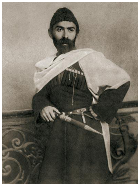
Коста Леванович Хетагуров