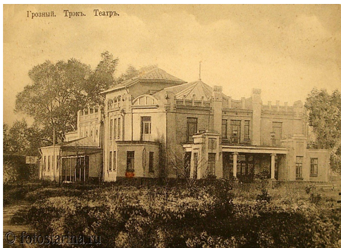
Грозный. Трэк. Театр.

– пишут исследователи. – Тем самым в многосоставном обществе Северного Кавказа русский сегмент выполнял большую функциональную нагрузку: с одной стороны, русские были носителями базовых институтов, функционирование которых интегрировало регион в пространство «большого общества» (или общества современного типа); с другой стороны, русские со своей колонизационной активностью и этнической инаковостью, самим своим присутствием в регионе представляли собой определяющий вектор его социального структурирования... Иными словами, русские занимали центральную позицию (статус) в социокультурной структуре региона» 99 .