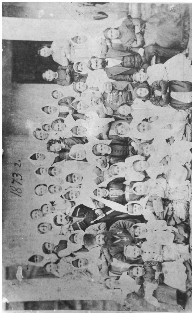
Воспитанницы Владикавказской Ольгинской школы. 1873 год