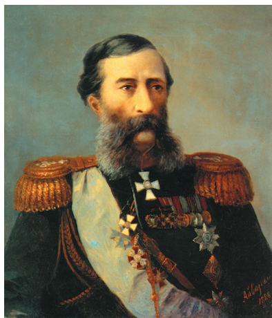
Михаил Таризович Лорис-Меликов

ликова с 1 января 1868 г., стала прообразом среднеспециального учебного заведения. Осетинские мальчики — ученики бывшей горской школы — обучались в ней за счет Общества восстановления православного христианства на Кавказе. Судя по отчету начальника Осетинского округа, к 1869 г. во Владикавказской прогимназии обучалось 27 мальчиков «из осетин», на содержание которых Общество выделяло 2160 руб. в год 360 . Через год после открытия Владикавказская прогимназия перешла из ведения Военного министерства под начало МНП 361 , оставаясь единственным казенным общеобразовательным учебным заведением в Терской области и вторым (после Ставропольской гимназии) — на Северном Кавказе, где могло получать образование горское юношество.