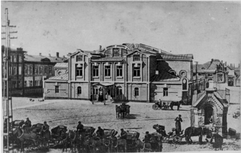
Владикавказ. Городской театр

за «правильным исполнением построек» 142 . Владикавказская городская дума издавала целый ряд «постановлений по строительной части», руководствуясь правилами Строительного устава. Одним из таких документов стало постановление Владикавказской городской управы от 23 июня 1884 г. об устройстве в городе тротуаров. Приведем его фрагмент: