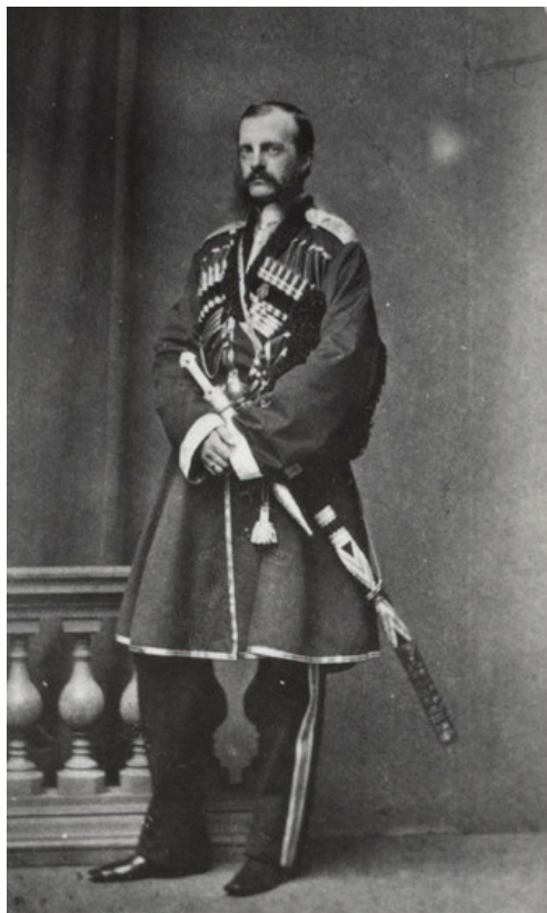
Михаил Николаевич, великий князь

найти общего языка с директорами подведомственных учебных заведений.