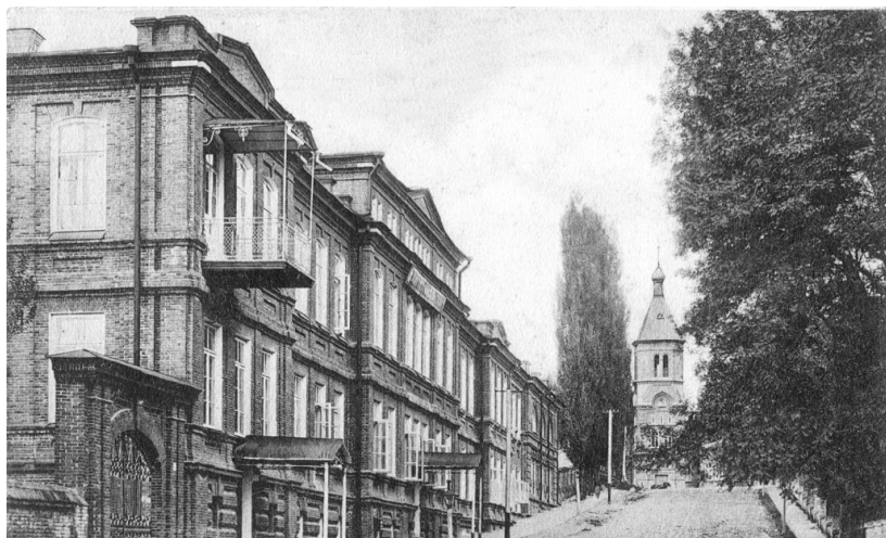
Владикавказская мужская гимназия

Благотворительные организации, развернувшие свою деятельность для «вспомоществования учащимся в учебных заведениях», оказывали финансовую поддержку ученикам из малоимущих семей. Одним из самых крупных было Общество вспомоществования учащимся в учебных заведениях г. Владикавказа, учрежденное в 1880 г. Его основной целью была материальная поддержка учащихся средних учебных заведений Владикавказа. Однако, если это позволяли средства, Общество бралось помогать ученикам и всех прочих учебных заведений города и их выпускникам, намеревающимся поступать в высшие учебные заведения. Уже в год основания Общества материальную поддержку в размере 635,5 руб. получило 50 человек, в 1882 г. была оказана помощь 160 учащимся, в 1883 г. — 154, в 1884 г. — 131 469 . Среди тех, кто получал вспомошествова-