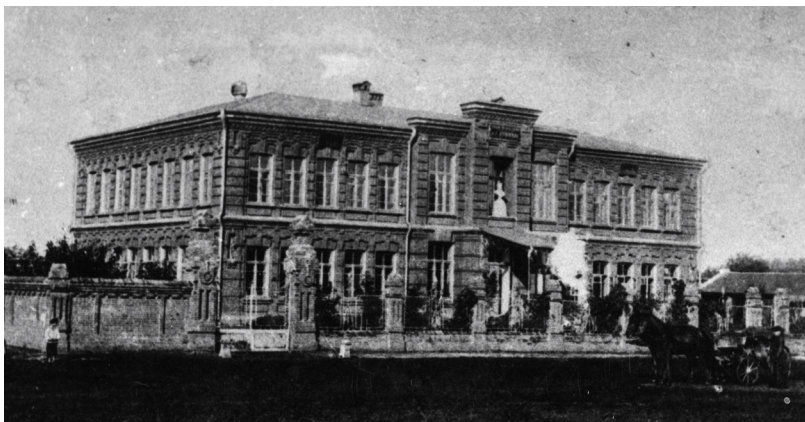
Пушкинская народная аудитория

В 1860-х гг. в стране насчитывалось не более 50 провинциальных публичных библиотек, находившихся под наблюдением Министерства народного просвещения. Но лишь немногие из них поддерживали связь с министерством, присылая туда отчеты о своей работе. С другой стороны, само учебное ведомство не имело достаточных средств для поддержания и развития библиотек, ограничиваясь лишь отправкой некоторых своих изданий и дидактических материалов. В отдельных городах МНП разрешало объединять публичные библиотеки с библиотеками учебных заведений и открывать их, при условии платы за пользование, сторонним читателям 613 .