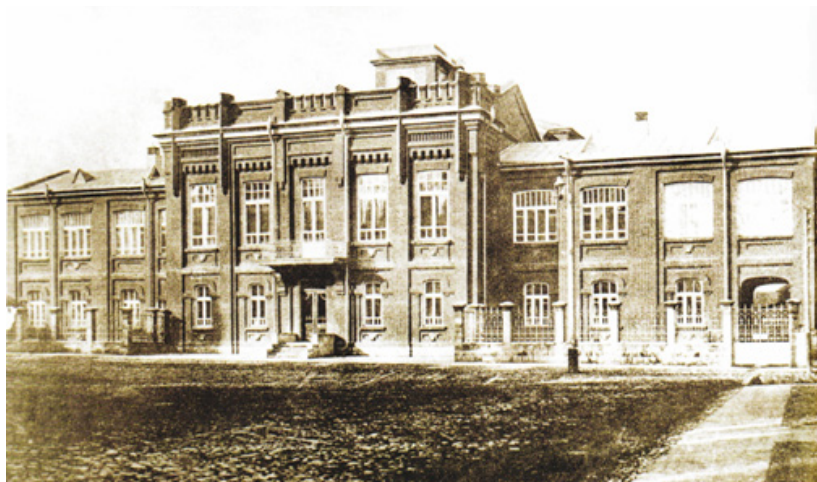
Владикавказское реальное училище

Вместе с тем, несмотря на искусственно пониженный статус, Владикавказское реальное училище сыграло значительную роль в развитии народного образования в Осетии. Оно давало своим воспитанникам прочные знания по разным областям, особенно по естественным наукам. К 1900 г. численность горцев в общем составе учащихся достигла 23,6%, причем среди них были представители разных народов Северного Кавказа: осетины, кабардинцы, балкарцы, чеченцы и др.