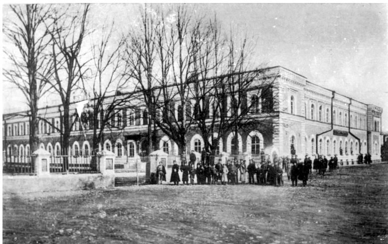
Владикавказское Лорис-Меликовское ремесленное училище