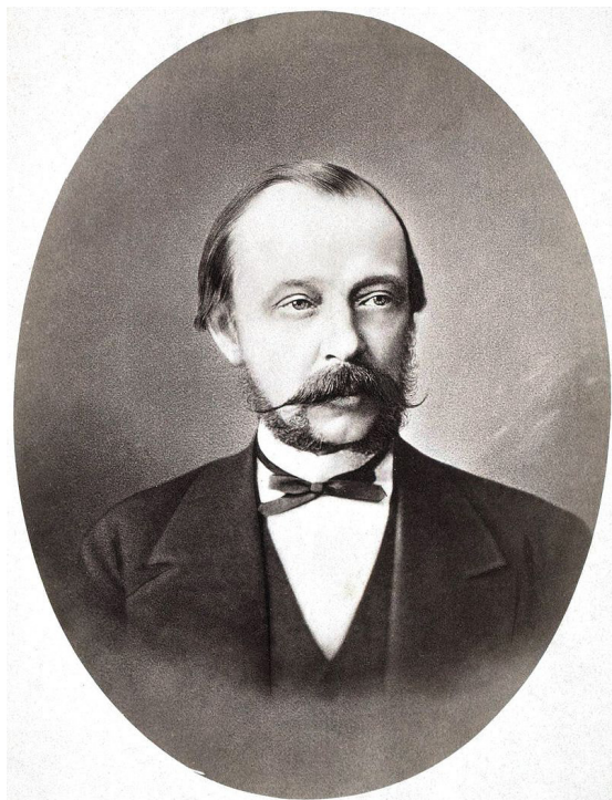
Дмитрий Андреевич Толстой

ков к одной «промышленной» профессии. Напротив, как подчеркивалось в разъясняющих документах, реальные училища сохраняли общеобразовательный характер 380 .