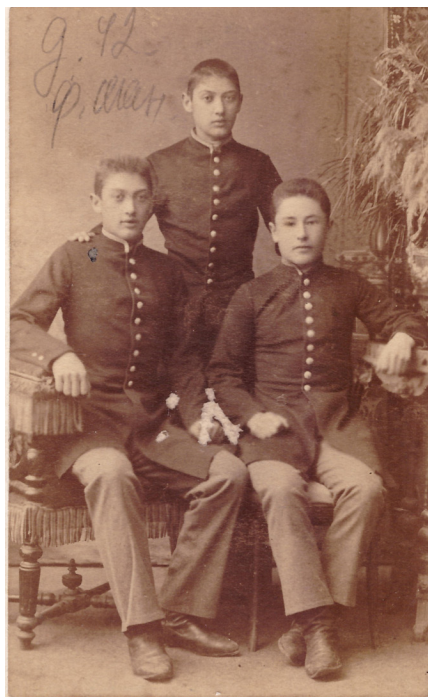
Мальчики-осетины, учащиеся г. Ставрополя. 1895 год

Такое положение объяснялось не только нехваткой людских и материальных ресурсов у ведомств, отвечавших за развитие в стране народного просвещения, но и принципиальными разногласиями во взглядах на характер и организационные формы образовательного процесса, которые отстаивали Министерство народного просвещения и его всемогущий оппонент Св. Синод. Начальная школа оказалась тем полем, на котором развернулась конкурентная борьба МНП и духовного ведомства за приоритет в образовательной сфере.