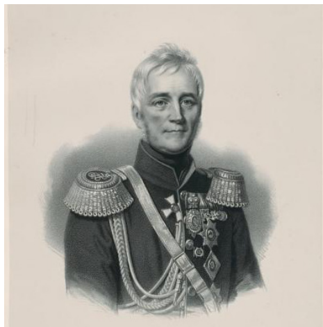
Михаил Семенович Воронцов

административном отношении и находился в непосредственном ведении самого наместника. Заведовал округом попечитель, который входил в Совет Главного управления Закавказским краем.