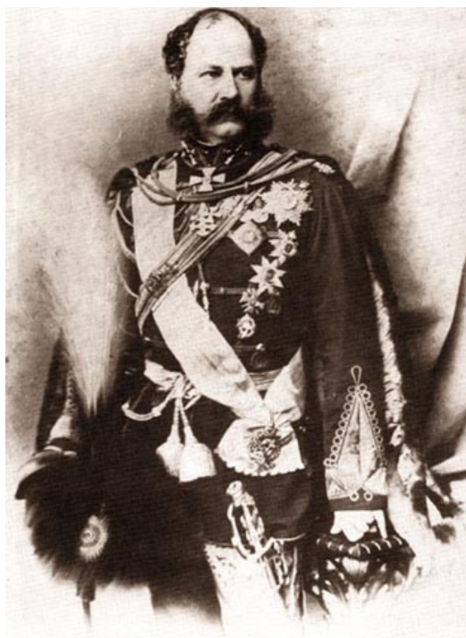
Александр Иванович Барятинский

горские школы) 275 , а также училища Бакинской и Эриванской губерний 276 . В 1862 г. срок действия нового положения был продлен до 1 января 1866 г.