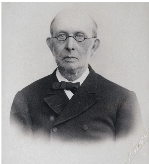
Константин Петрович Победоносцев

начало 1880-х гг. Исходя из собственных представлений о роли церкви в соблюдении государственных интересов и взглядов на соотношение в учебном процессе светского образования и морально-нравственного, религиозного воспитания, Победоносцев инициировал реформу начального школьного образования. Она стала важным событием во внутривластительской жизни Российской империи. В центре реформы находилась приходская школа, изначально игравшая роль основного инструмента идеологического воздействия на низшие слои населения.