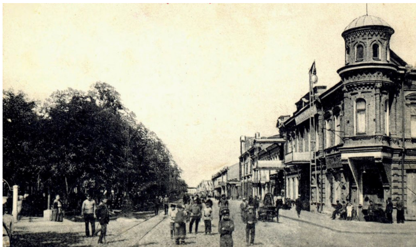
Владикавказ. Гостиница «Париж»

в городе уже были выстроены и успешно работали гостиницы «Бристоль», «Гранд-Отель», «Европа», «Империял», «Париж» 200 .