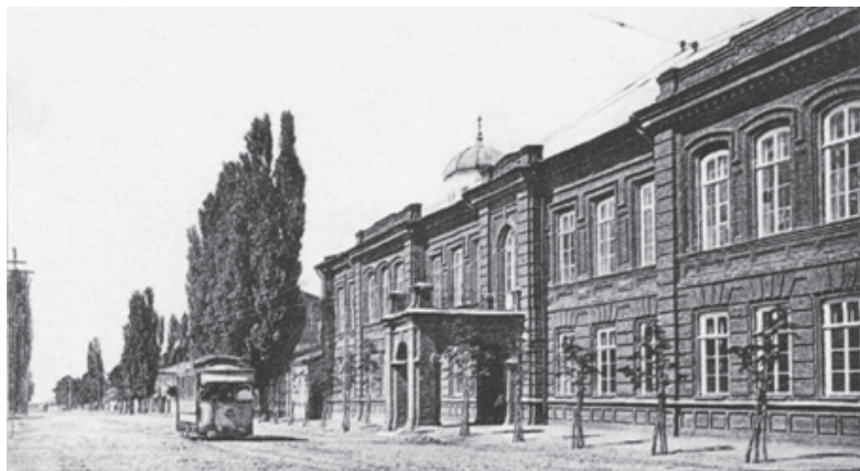
Владикавказ. Ольгинская женская гимназия

ях, в три раза по сравнению в середине 1850-х гг. выросло число учеников в учебных заведениях разного типа (см. табл. 5, 6).