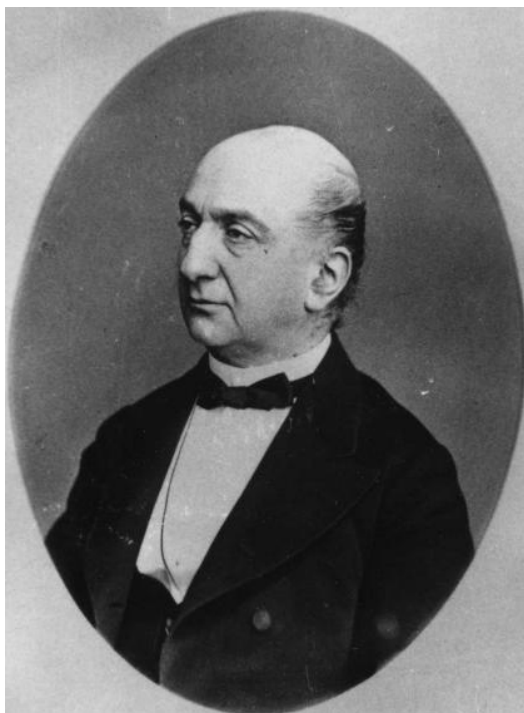
Иван Давыдович Деянов

Что же касается «инородцев», то в правительстве были убеждены, что «по слабому культурному развитию» их образовательные потребности «совершенно удовлетворялись системой начального образования» 475 .