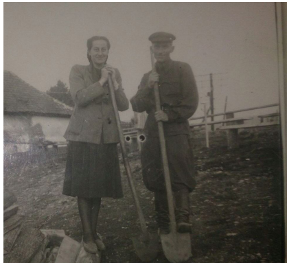
7. На строительстве своего дома (1947 г.)