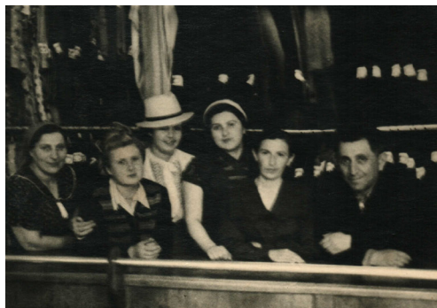
70. Заходите к нам в магазине (1952 г.)