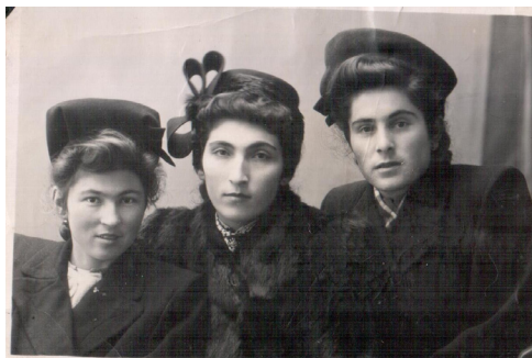
35. Городские модницы (1946 г.)