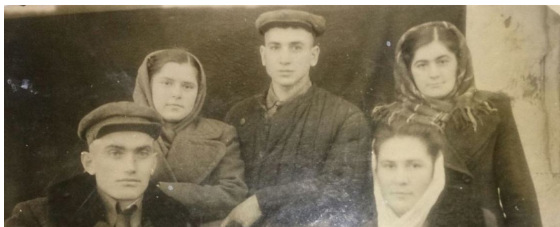
73. Молодые рабочие г. Дзауджикау (1947 г.)