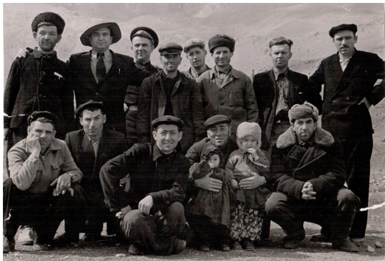
28. В Куртатинском ущелье (1953 г.)