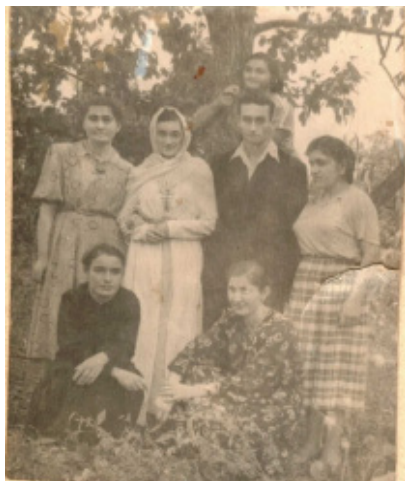
74. Свадьба (1955 г.)