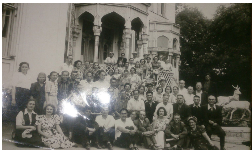
12. В санатории (Цей, 1946 г.)