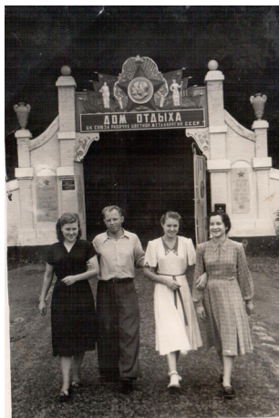
16. Молодежь на отдыхе (1948 г.)