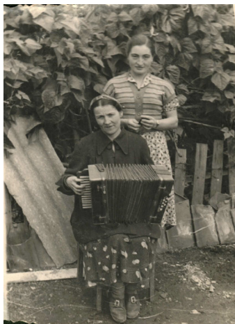
75. Сельская гармонистка (1949 г.)