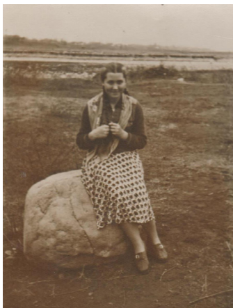
30. На берегу Терека (1948 г.)