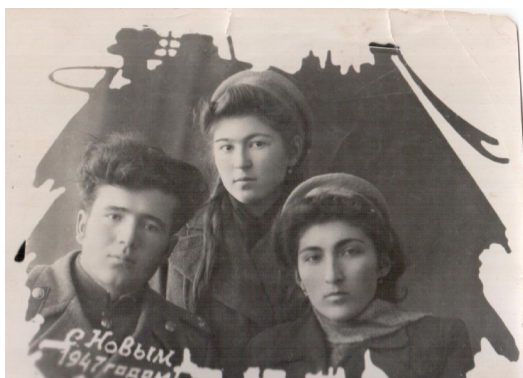
38. В преддверии Нового года (1947 г.)