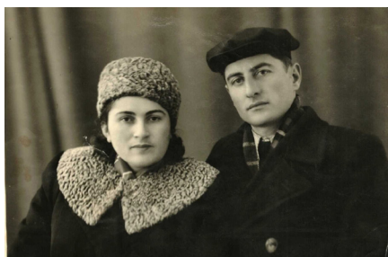
71. Чета Дзэбоевых (1951 г.)