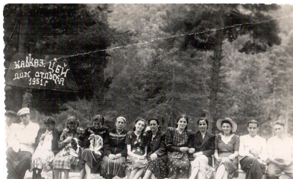
61. Отдыхающие (1951 г.)