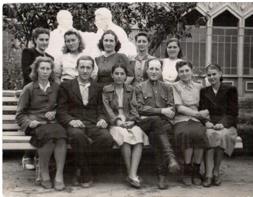
60. На фоне классиков снимается молодежь (1950 г.)