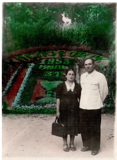
19. У фонтана (1957 г.)