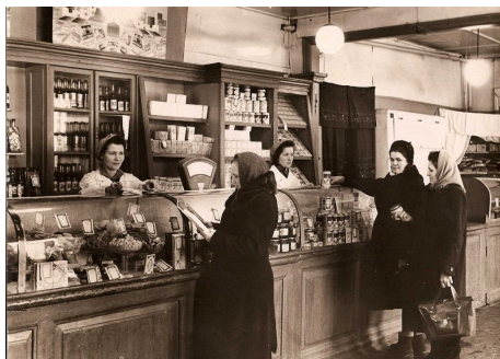
57. В магазине (1947 г.)