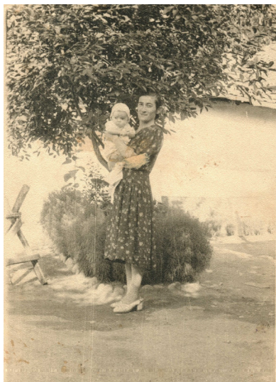
76. Новое поколение (1958 г.)