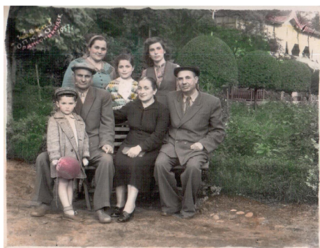
18. В городском парке (1957 г.)