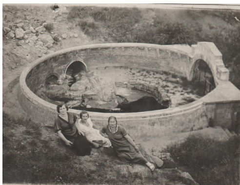
5. На отдыхе (1948 г.)