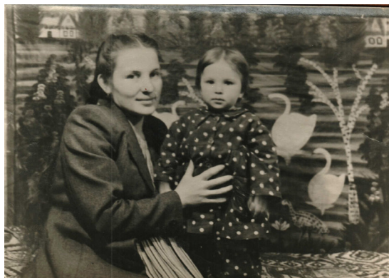
53. Мама и я на фоне лебедей (1949 г.)