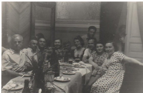
25. Застолье (1947 г.)