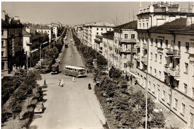
63. Новые районы г. Дзауджикау (1952 г.)