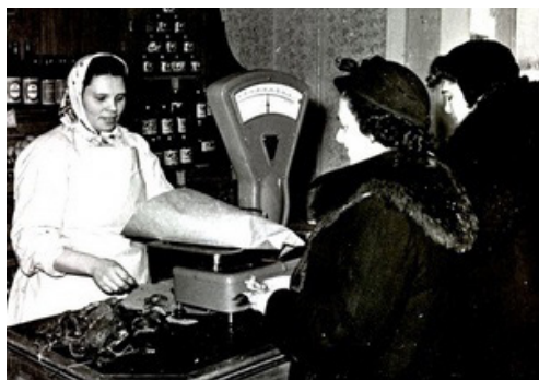
67. В городском магазине (1949 г.)