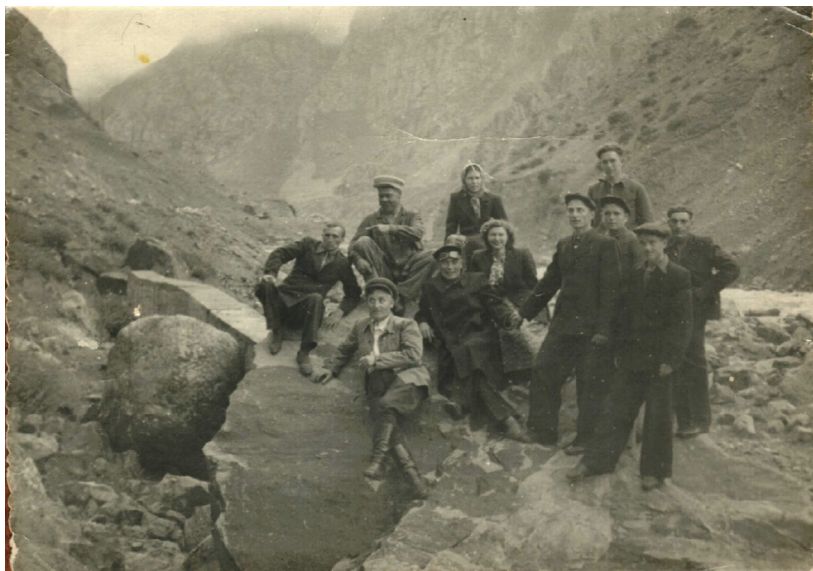
11. Экскурсия в горы (1948 г.)