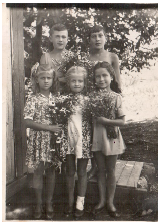
47. Счастливое детство (1946 г.)