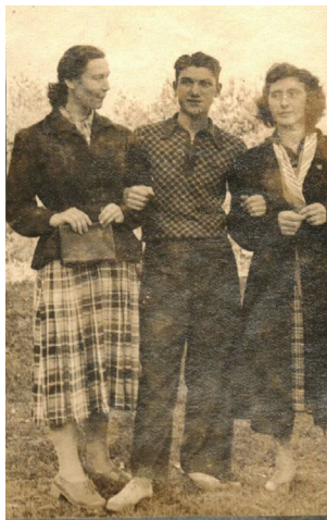
69. Весна на Осетинской слободке (1951 г.)