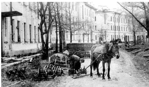
64. Самый надежный транспорт (1946 г.)