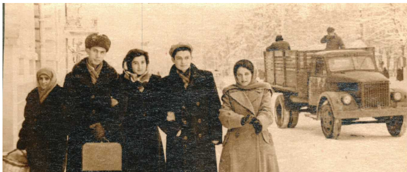
72. Молодежь Осетинской слободки (1949 г.)