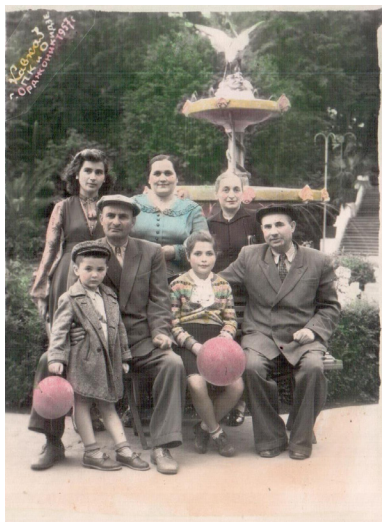
20. На отдыхе в Кисловодске (1953 г.)