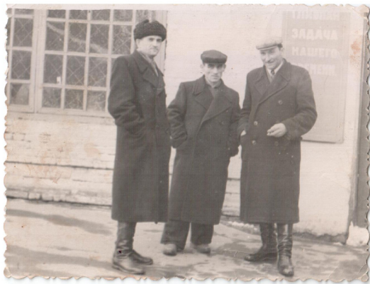
36. Три товарища (1956 г.)