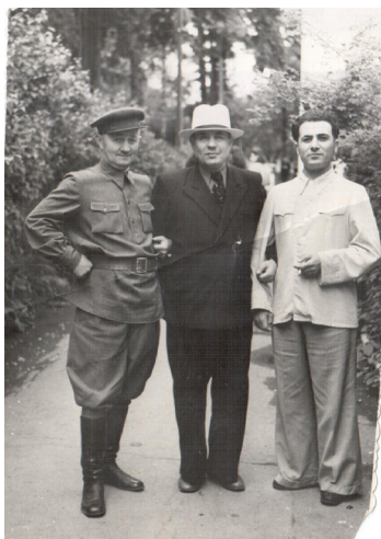
48. В парке (1947 г.)