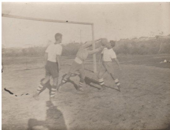
3. Любительский футбол (1946 г.)