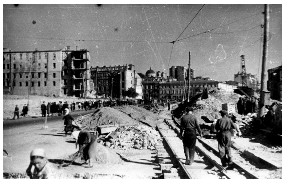
65. Восстановление города (1945 г.)