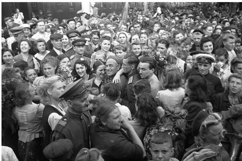
80. Встреча фронтовиков на городском железнодорожном вокзале (1945 г.)