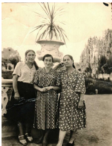
59. И снова в парке (1955 г.)