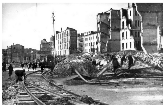
62. Разрушенный г. Дзауджикау (1945 г.)