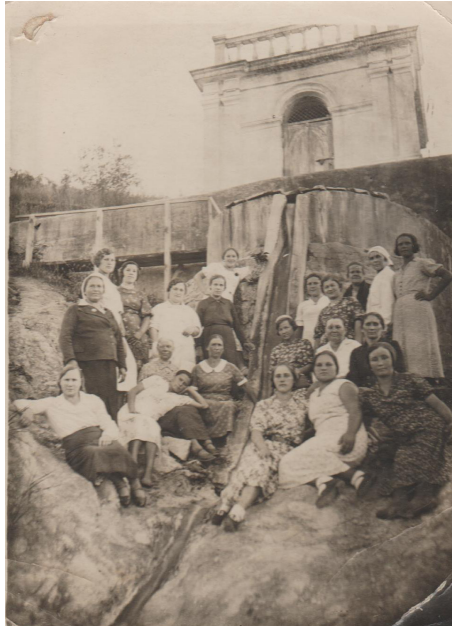
2. Трудовой субботник (1947 г.)