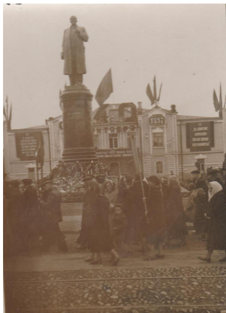
9. Демонстрация, посвященная 40-й годовщине октябрьской революции (1957 г.)