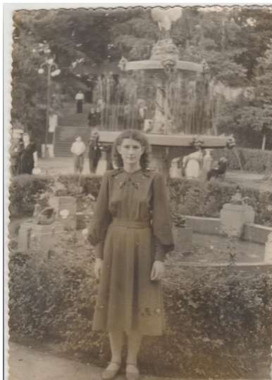
56. На фоне фонтана (1947 г.)