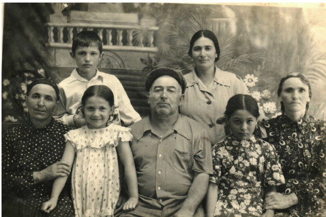
54. Большая семья (1948 г.)