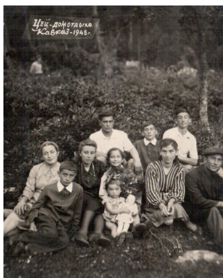
15. На отдыхе в Цее (1948 г.)