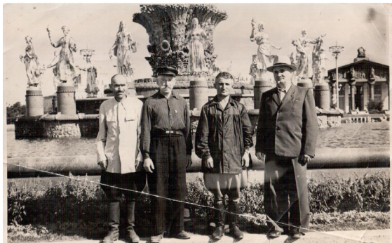
43. После приема у И. Сталина (крайний слева Д. Сланов) (Фонтан «Дружба народов» ВДНХ) (1951 г.)