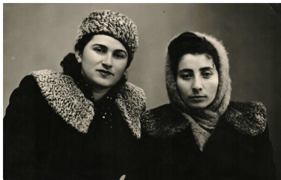
51. Молодые горожанки (1952 г.)