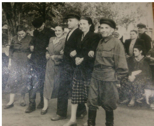
34. Послевоенный танец симд (1945 г.)