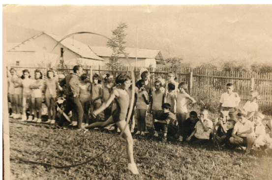
32. Спортивные соревнования (1955 г.)