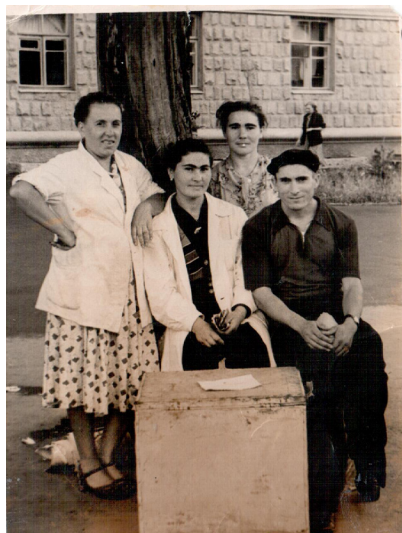
39. Уличная мороженщица (1956 г.)