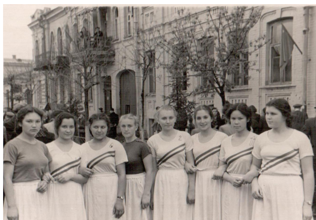
21. Физкультурницы (1948 г.)