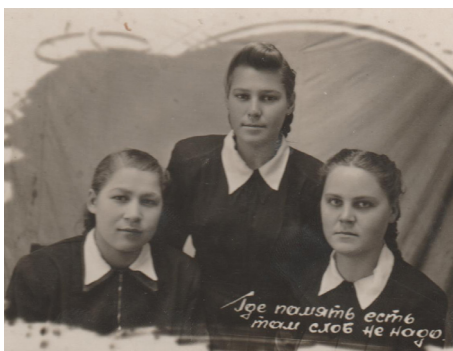
42. Три подружки (1948 г.)