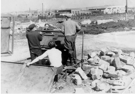
1. Город восстанавливается (1945 г.)