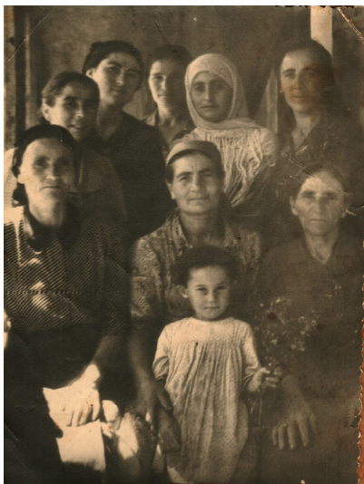
55. Сельские посиделки (1947 г.)