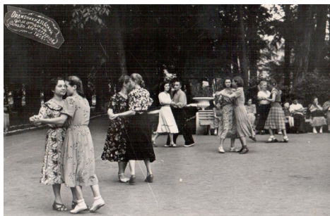
14. На танцах (1955)