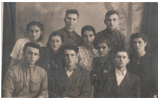
37. Студенчество города (1946 г.)