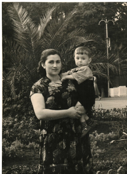
23. В городском парке (1956 г.)