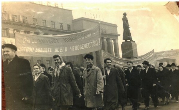
8. Октябрьская демонстрация в г. Дзауджикау (1955 г.)