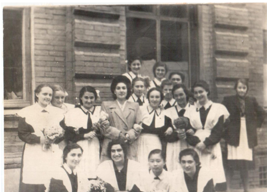
45. Последний звонок (1947 г.)