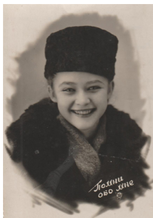
4. Молодая горожанка (1947 г.)