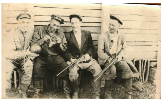
31. На сельской завалинке (1946 г.)