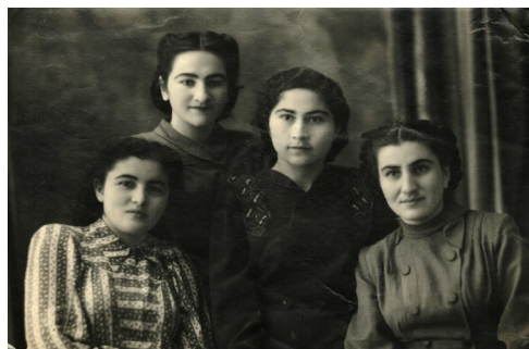
50. Как молоды мы были...(1948 г.)