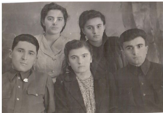
26. Студенты СОГПИ (1948 г.)