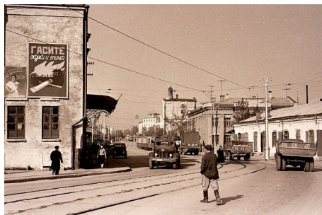
46. Городской перекресток (1947 г.)