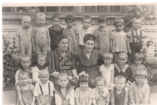
58. В детском саду (1947 г.)