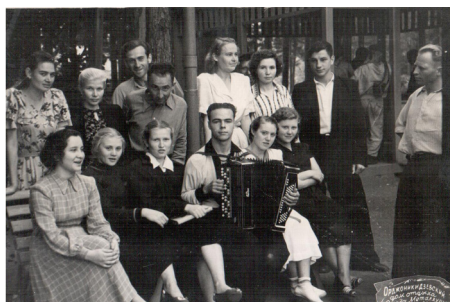
17. Песни под гармонь (1948 г.)