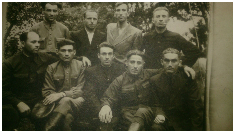
81. Коллективный портрет победителей (1945 г.)