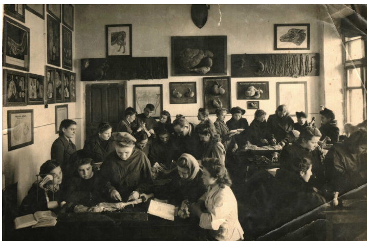
10. На занятиях студентов зоофака сельскохозяйственного института (1949 г.)