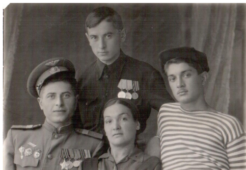
44. Гвардейская семья (1946 г.)