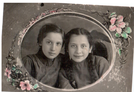
49. Девочки (1946 г.)