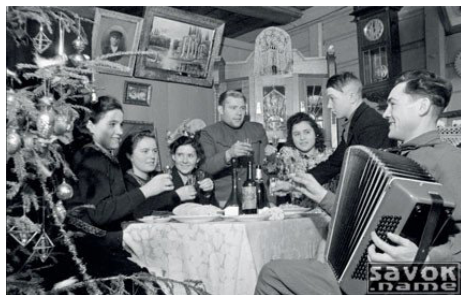
66. Новый победный год (1945 г.)