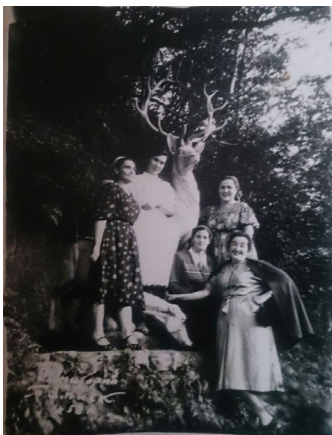
33. На отдыхе в цейском санатории (1958 г.)