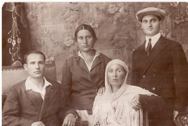
22. Городская молодежь (1945 г.)