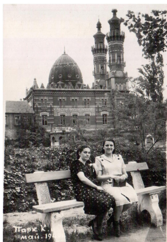
41. На набережной (1948 г.)